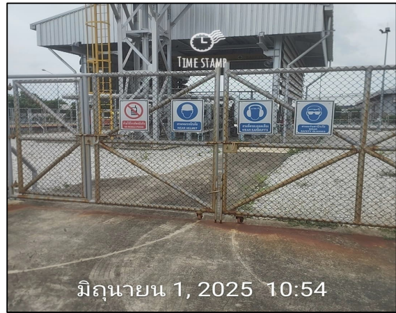
ป้ายเตือนความปลอดภัย