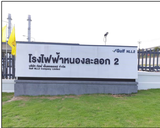
ป้ายแสดงสถานี