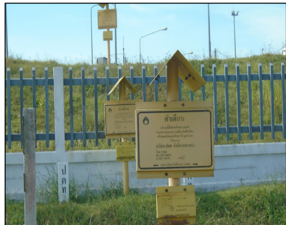
ป้ายเตือนแนวท่อส่งก๊าซธรรมชาติ

ภาพที่ 3.2-17 ภาพถ่ายระบบรักษาความปลอดภัยบริเวณสถานีก๊าซและ โครงการท่อส่งก๊าซธรรมชาติไปยังโรงไฟฟ้าหนองละลอก 2